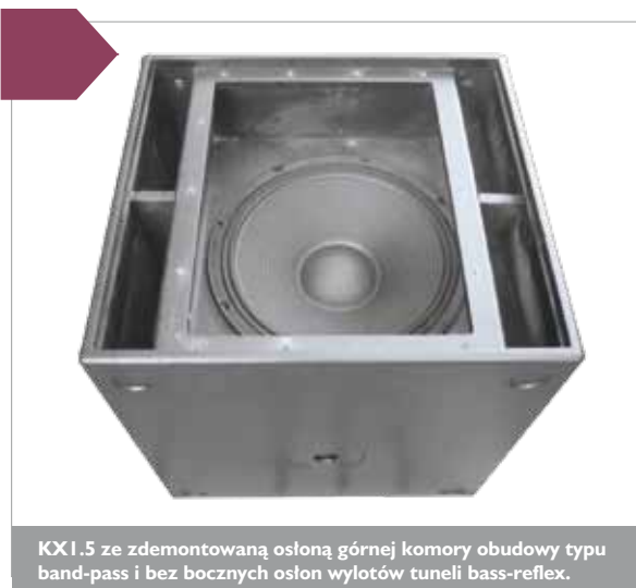
KX1.5 ze zdemontowaną osłoną górnej komory obudowy typu band-pass i bez bocznych osłon wylotów tuneli bass-reflex.

Subwoofer KX1.5 to niewielka paczka, która została wykończona inaczej niż satelita. Pokryto ją czarnym lakierem strukturalnym, bez umieszczania jakichkolwiek narożników. Tego typu wykończenie bardzo dobrze się prezentuje, niemniej jeśli subbas ma być transportowany, warto zaopatrzyć się w miękkie pokrowiec. Jedynym wspólnym elementem designu są niewielkie osłony wylotów tuneli bass-reflex po lewej i prawej stronie zestawu, w których znajdziemy siatkę identyczną jak na froncie zestawu szerokopasmowego. Jeśli jednak ustawimy kolumny jedna na drugiej, różnice w sposobie wykończenia nie rzucają się specjalnie w oczy i efekt estetyczny jest zupełnie przyzwoity. Na wierzchniej ścianie obudowy subbasu możemy dostrzec głęboko cofnięte gniazdo statywu oraz wyfrezowane wgłębienia służące do stabilnego ustawienia drugiego identycznego subbasu, gdyż na jego spodzie znajdują się dopasowane odpowiednio nóżki. Wymuszenie stosunkowo głębokiego cofnięcia satelity związane jest ze znaczną różnicą gę-