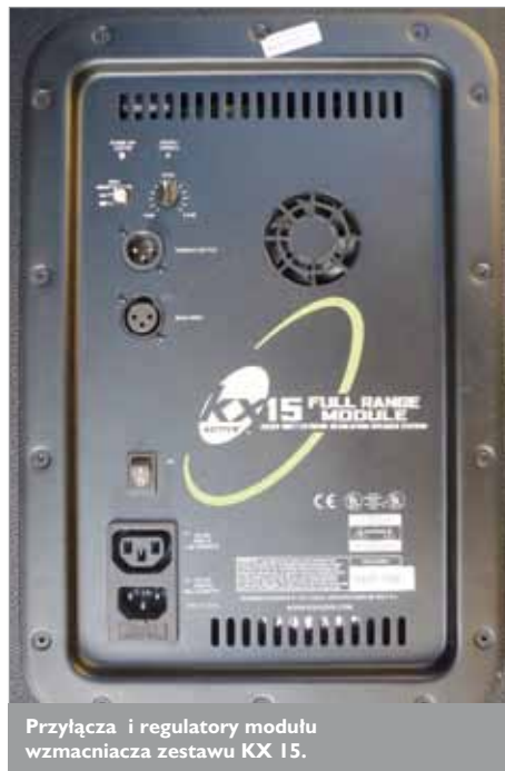
Przyłącza i regulatory modułu wzmacniacza zestawu KX 15.

zależnością czułości od częstotliwości, może powodować niezbyt precyzyjne informowanie o faktycznym poziomie wysterowania wzmacniaczy i głośników. Ponieważ jest to już kolejny przypadek rozbieżności mocy deklarowanej i faktycznie zmierzonej, zwróciłem się do dystrybutora z prośbą o wyjaśnienia. Według informacji uzyskanych na drodze mailowej, moc zestawów KX firma definiuje jako BURST POWER. Ponieważ nie udało mi się znaleźć oficjalnej definicji mocy podawanej w taki sposób, mogę jedynie zasugerować, że może chodzi o testowanie „paczkami” impulsów. Jeśli chodzi o wzmacniacz drivera, to udało mi się „wycisnąć” z niego około 30 W RMS – jest to wartość do zaakceptowania, gdyż przetwornik w połączeniu z tubą ma bardzo dużą skuteczność i taka moc mu w zupełności wystarcza. Punkt podziału między głośnikami znajduje się dość nisko, bo już na 1 kHz, co sprawia, że bardzo dużą rolę odgrywa