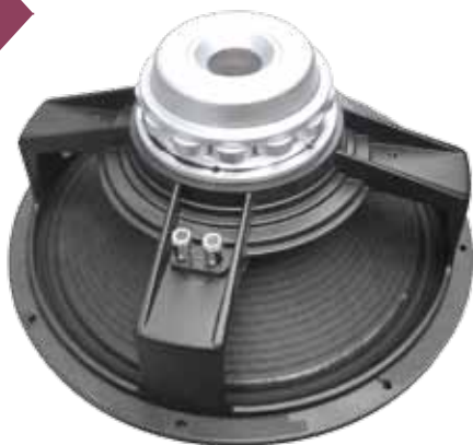
Głośnik niskotonowy w subwooferze wyposażony jest w neodymowy obwód magnetyczny, mocowany na koszu odlewanym z aluminium.