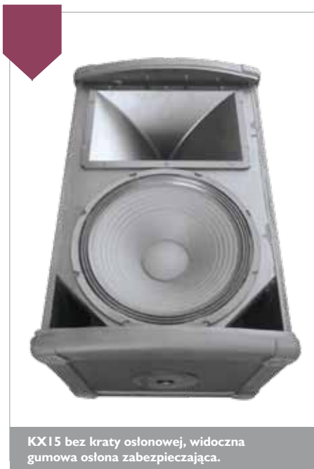
KX15 bez kraty osłonowej, widoczna gumowa osłona zabezpieczająca.

bokoci obu paczek, a dodatkowo z cofnięciem głośnika basowego o około 15 cm względem przedniej krawędzi obudowy z racji zastosowania układu typu bandpass, charakteryzującego się dodatkową komorą akustyczną od frontu głośnika.