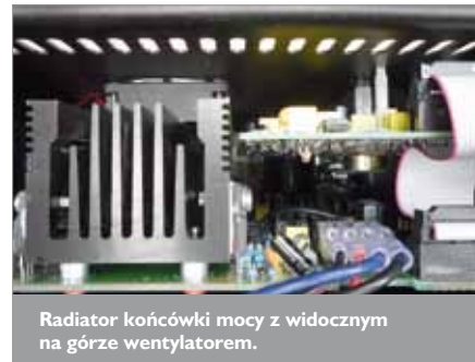
Radiator końcówki mocy z widocznym na górze wentylem.

zestawów dotknęła już chyba większość producentów, którzy ścigając się z konkurencją, zawsze starają się być o krok do przodu, albo co najmniej w tym samym szeregu, co pozostali.