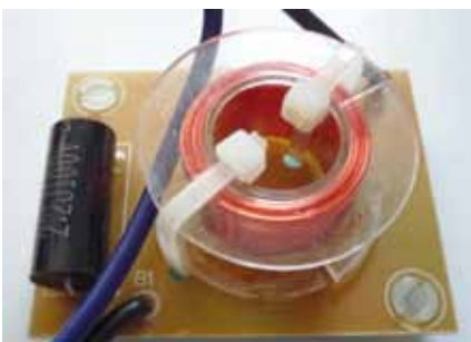
Dodatkowy pasywny układ korekcyjny włączony na wejściu drivera służy do wyrównania charakterystyki przetwornika.