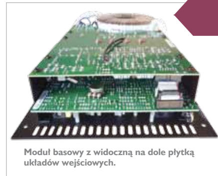
Moduł basowy z widoczną na dole płytą układów wejściowych.

W przypadku subbasu sytuacja z mocą wygląda podobnie, gdyż tylko o kilka voltów zwiększono napięcie wtórne niewielkiego transformatora, o mocy sporo mniejszej niż deklarowana moc zestawu. Mnie „chwilowo” udało się osiągnąć około 350 W RMS, ale już po sekundzie wysterowania stałym przebiegiem sinusoidalnym, moc ta spada dwukrotnie i utrzymuje się na takim poziomie, dopóki nie zmniejszymy znacząco poziomu wysterowania. Muszę przy tym wyraźnie podkreślić, że „plaga” zawyżania mocy