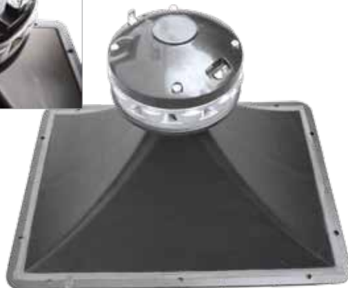
W driverze użyto tytanowej membrany z cewką o średnicy 2,5".

dużego rorna z tworzywa, który zajmuje znaczną część powierzchni płyty czołowej zestawu. Tuba ma rozproszenie 80 \times 40 stopni, przy czym możemy ją obrócić o kąt prosty, jeśli zajdzie potrzeba zestawienia ze sobą kilku KX15 obok siebie bądź podwieszenia zestawu w poziomie.